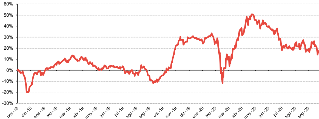
— AGF-Abante Biotech-C