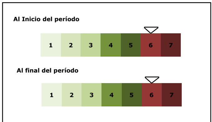
NIVEL DE RIESGO DE SU INVERSIÓN AL INICIO Y AL FINAL DEL PERIODO