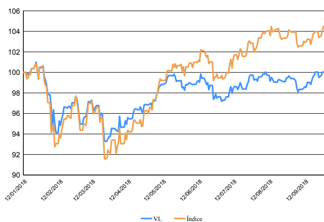
Evolución del Valor Liquidativo de los Últimos 5 años

En el caso de inversiones en IIC que no calculan su ratio de gastos, éste se ha estimado para incorporarlo en el ratio de gastos sintético.