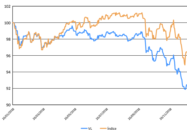
Evolución del Valor Liquidativo de los Últimos 5 años

En el caso de inversiones en IIC que no calculan su ratio de gastos, éste se ha estimado para incorporarlo en el ratio de gastos sintético.